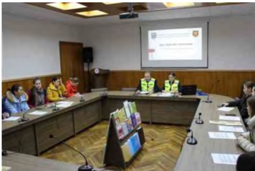
Fig.5 Campania ”16 zile de activism împotriva violenței în bază de gen”

În luna noiembrie în cadrul campaniei ”16 zile de activism împotriva violenței în bază de gen” au desfășurate activități informative în colaborare cu Biroul de Probațiune Taraclia. Scopul activităților date este de a ridica nivelul de conștientizare privind problema violenței împotriva femeilor și copiilor.