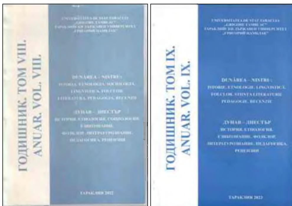
Fig.10 Producția științifică a cadrelor științifico-didactice ale US Taraclia

În recunoașterea valorii realizărilor științifice se ține cont , de aspectul calitativ, după următoarele criterii: importanța teoretică pentru dezvoltarea științei în general și pe domenii de specialitate; prioritățile pe plan național și internațional; impactul social al cercetărilor; perfecționarea învățământului și modernizarea mijloacelor de învățământ. Pentru comunicarea rezultatelor cercetărilor întreprinse la nivelul Universității și al Catedrei sunt organizate seminare științifice, conferințe și alte manifestări științifice.