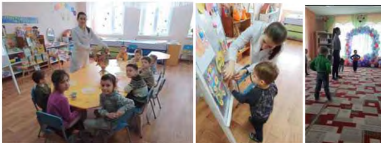
Fig.4 Stagiul de practică la specialitatea "Pedagogie preșcolară și limba și literatura română"

propus, vizibilitatea, abordarea individuală, principiul dezvoltării, principiul abordării sistemice, principiul comunicării vorbirii cu alte aspecte ale dezvoltării mentale) .Mediu pe grup – 9.57.