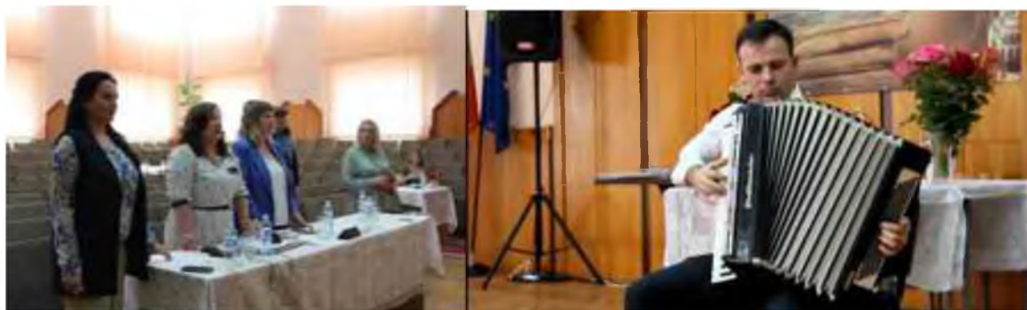
Fig. 1 Examenul de licență la programele de studii "Muzică"

Toți președinții comisiilor de stat au remarcat unanim că condițiile de organizare a examenelor de licență au fost foarte bune, ce a favorizat crearea stării de bine pentru absolvenți. Administrația Universității a oferit toată documentația necesară pentru desfășurarea examenelor de licență. Biletele de examen au fost întocmite și aprobate în timp util, a fost asigurată securitatea biletelor de examen, sălile pentru desfășurarea examenelor și susținerea tezelor de licență au fost bine echipate. Președinții comisiilor de licență remarcă, de asemenea, pregătirea bună a studenților pentru susținerea examenelor de licență și a tezelor de licență.