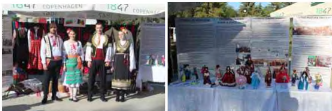
Fig.7 Festivalul etnofolcloric

Un eveniment notabil în viața universității a fost organizarea și desfășurarea conferinței științifice internaționale în cadrul US Taracalia, ediția a X-a Межэтнические взаимодействия в этноконтактной зоне desfășurată la 27 octombrie 2022.