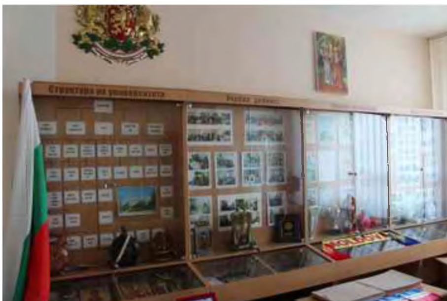
Fig.17 Muzeul de Istorie a Universității

Obiectivele, stabilite în cinstea celei de-a 18-a aniversare a Universității, au fost, în general, îndeplinite la 1 octombrie 2022. Calitatea cunoștințelor dobândite de studenți a crescut semnificativ, multe eforturi și fonduri au fost investite în consolidarea bazei tehnico-materiale atât a blocurilor de studii, cât și a căminului studentesc. Au fost deschise două muzee (1 – Muzeul etnografic în scopuri educaționale, mai ales pentru specialitatea Istorie , și 2 – Muzeul de Istorie al Universității, care cuprinde toată istoria Universității din primele zile de la înființare – 30 martie 2004 și până în prezent). Muzeele au devenit o adevărată mândrie a Universității, pentru că vizitele făcute de oaspeți la Universitate întotdeauna se încheie cu o vizită la muzeele menționate.