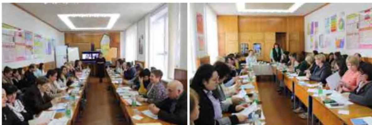
Fig.9 Training-ul pentru cadrele manageriale și didactice din instituțiile preuniversitare

Scopul principal al training-ului este oferirea de recomandări metodologice și demonstrarea tehnologiilor interactive privind aspectele metodologice ale educației interculturale.