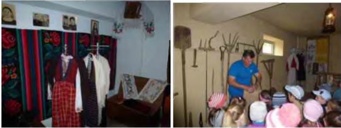
Fig.11 Muzeul etnografic al universității

În perioada raportată, reprezentanții universității au prezentat rapoartele la o serie de conferințe științifice desfășurate în Moldova. Participarea la forumuri străine este îngreunată, în primul rând, de lipsa banilor și, prin urmare, este limitată la țările vecine: Ucraina, România, Rusia și Bulgaria. Cu toate acestea, personalul de conducere al UST a participat la forumuri internaționale, iar referatele acestuia au fost incluse în culegeri corespunzătoare.