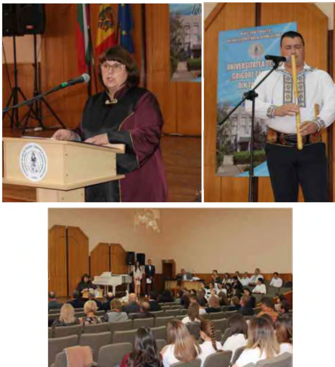
Fig.14 1 octombrie 2022 Universitatea de Stat "Gr.Țamblac" din Taraclia a împlinit 18 ani.

În perioada de 27 octombrie 2022 US Taraclia , în cooperare cu Universitatea de Stat din Tomsk, cu redacția revistei internaționale „Rusin”, Asociația Publică „Rus”, a organizat o conferință internațională ( în regin online și offline) științifico- practică Interacțiuni interetnice în zona de etno-contact ( Ediția a X-a) . Conferința a reunit 72 de oameni de știință din instituții științifice din Moldova, România, Ucraina, Rusia,. Au fost prezentate 59 de manifestări științifice.