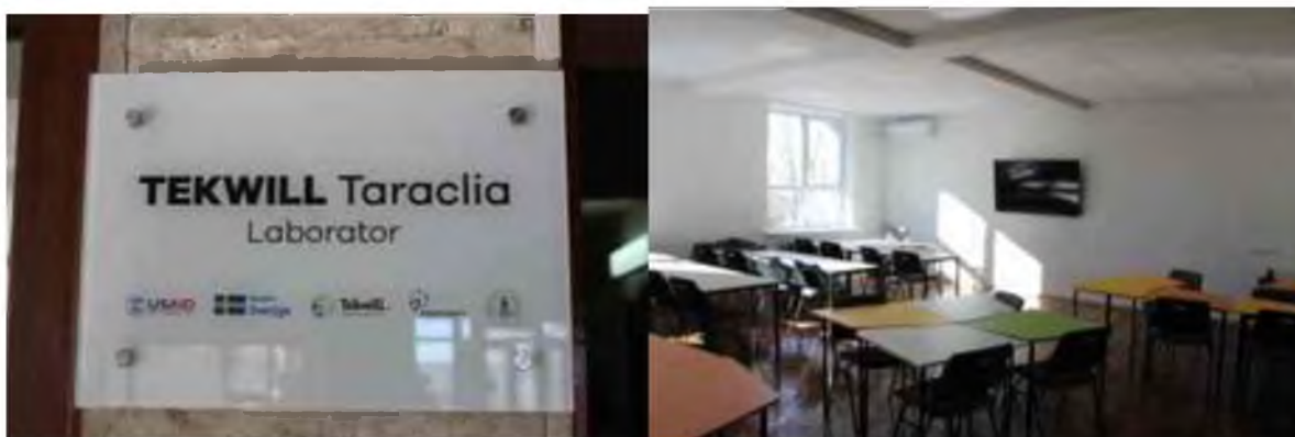
Fig. 6 Centrul TEKWILL Taraclia

Deschiderea Centrului oferă studenților US Taraclia și raionului Taraclia noi oportunități de dezvoltare cu succes, oportunitatea de a deveni mai atractiv pentru populația activă și va contribui la micșorarea scurgerii populației din raion. Scopul principal al cursurilor de formare IT este de a preda cunoștințe de bază, abilități și competențe în programare, de a pregăti studenții pentru admiterea la o universitate prestigioasă, de a oferi o oportunitate de a învăța o nouă profesie în IT și de a promova profesioniști din diferite sectoare în cariera lor.