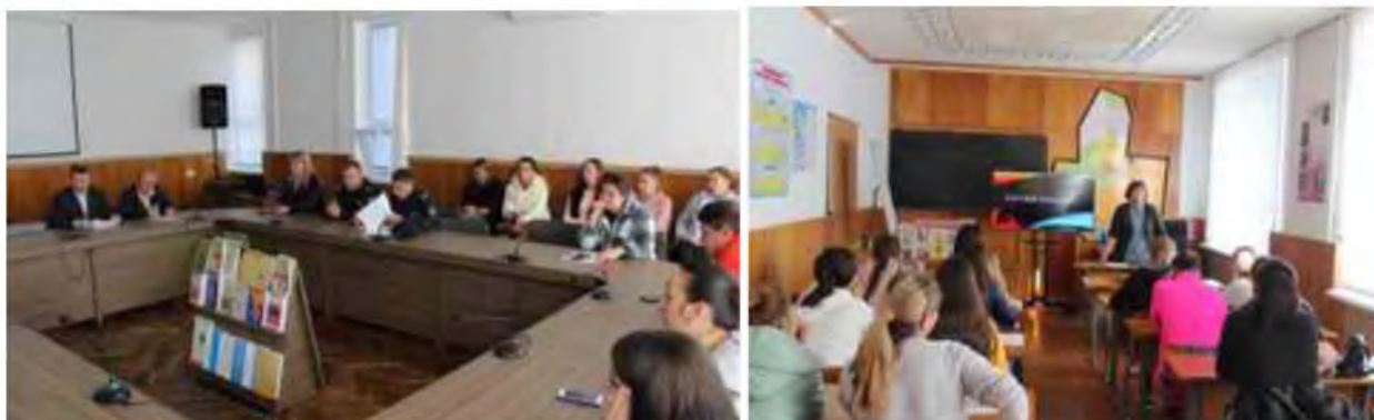
Fig.3 Ziua Europeană a luptei împotriva traficului de ființe umane.

La 18 octombrie 2022 a fost marcată Ziua Europeană a luptei împotriva traficului de ființe umane. În această săptămână, studenții au participat la prelegerea reprezentanților organelor de drept și ai Procuraturii. Au participat la masa rotundă cu tema: "Factorii economici și psihologici ai traficului de ființe umane"