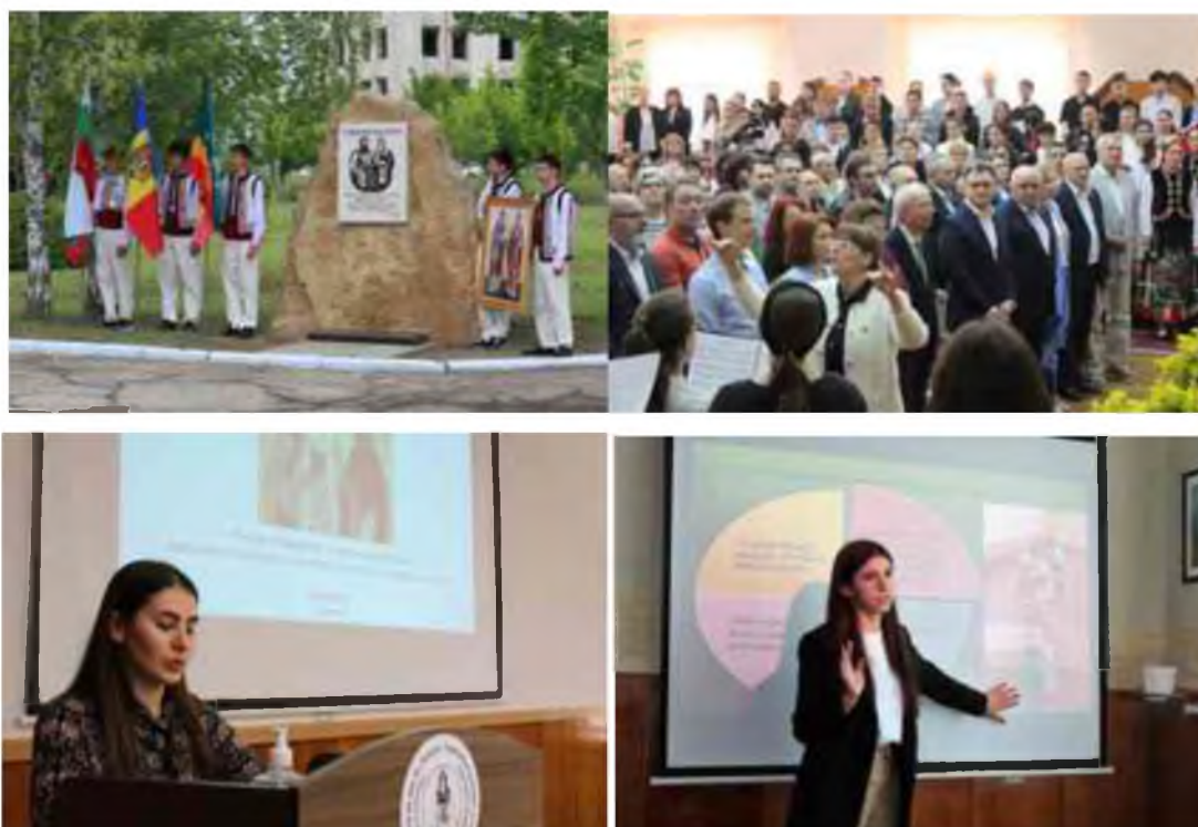
Fig.13 Conferință științifică - practică anuală dedicată Zilei scrisului și culturii slavone

2. Conferință științifică - practică anuală dedicată Zilei scrisului și culturii slavone desfășurată la 23 mai 2023 cu participarea reprezentanților din Moldova, Ucraina. Materialele științifice ale conferinței internaționale au fost publicate în anuarul UST „Дунав – Днестър”. Обществознание. Езикознание. Педагогика. Volumul IX. – Taraclia, 2023.