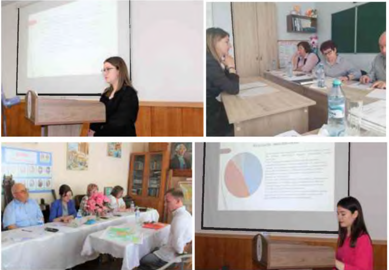
Fig. 2 Examenul de licență la programele de studii "Istorie", "Limba și literatura bulgară/ Limba și literatura română"; "Pedagogie preșcolară/ Limba și literatura română"

Toți membrii comisiei de licență au evaluat competențele profesionale ale studenților absolvenți. Secretarul a stabilit rezultatele examenelor în procesele-verbale ale ședinței comisiilor de licență.