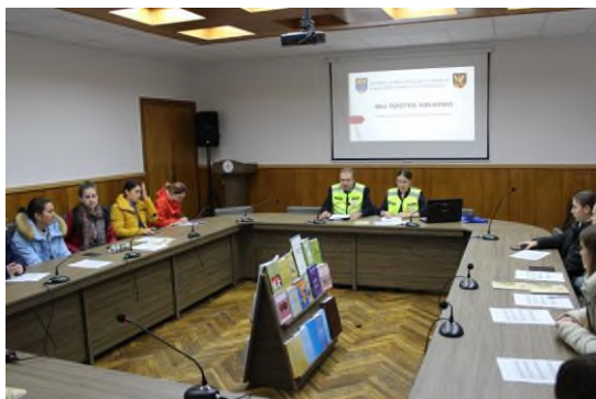
Fig. 5 Campania "16 zile de activism împotriva violenței în bază de gen"

Programul național de asigurare a egalității de gen în Republica Moldova prevede o abordare complexă de integrare a principiului egalității între femei și bărbați în documentele de politici din toate domeniile și la toate nivelurile de adoptare și implementare a deciziilor. Scopul acestui program rezidă în asigurarea promovării egalității de gen în viață economică, politică și socială a femeilor și bărbaților, aceasta constituind baza respectării drepturilor umane fundamentale ale tuturor cetățenilor țării. Prin urmare, în cadrul US Taraclia recomandările acestui program sunt realizate pe deplin, ceea ce demonstrează reprezentativitatea de gen în cadrul structurilor de conducere de toate nivelurile.