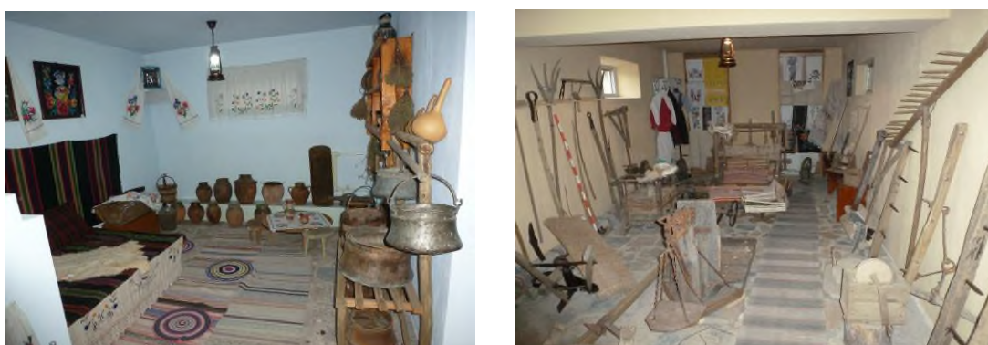
Fig. 11 Muzeul etnografic al universității

Pe tot parcursul anului s-a lucrat regulat muzeul etnografic al universității (responsabil - N. Mostovoi). Acesta a fost vizitat în scopuri științifice și educaționale nu numai de studenții și angajații Universității, dar și de elevi și copii din instituțiile preuniversitare, precum și de mulți locuitori și vizitatori ai Universității.