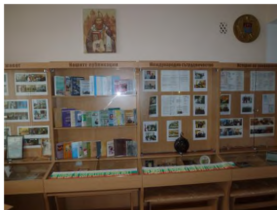
Fig. 16 Muzeul de Istorie a Universității

Ca și înainte, constatăm un număr redus de studenți înmatriculați la Universitatea noastră, dar nici nu poate fi altfel, pentru că Universitatea a fost înființată pentru rezolvarea problemelor educaționale ale minorităților naționale și, după cum se vede în practică, a familiilor cu venituri reduse. Cu toate acestea, Universitatea de Stat din Taraclia mai are de înfruntat multe probleme.