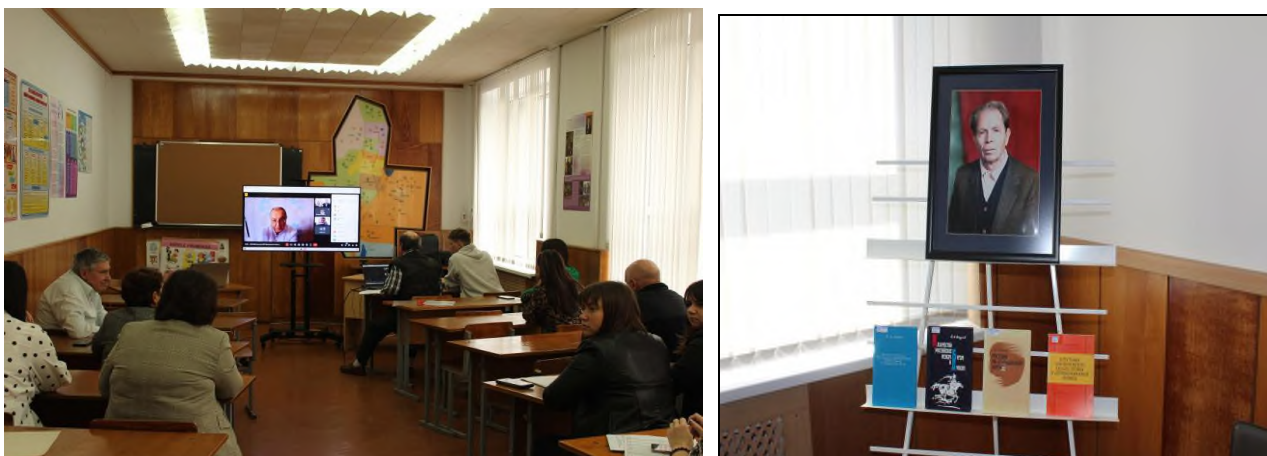
Fig. 12 Conferința științifică internațională ”Межэтнические взаимодействия в этноконтактной зоне”

1. Un eveniment notabil în viața universității a fost organizarea și desfășurarea conferinței științifice internaționale în cadrul USTaraclia, ediția a XII-a Межэтнические взаимодействия в этноконтактной зоне desfășurată la 27-28 octombrie 2023 cu participarea reprezentanților din Moldova, Ucraina, Germania, Federația Rusă (or. Tomsk, Sankt-Petersburg) în regim online. Materialele științifice ale conferinței internaționale au fost publicate în anuarul UST „Дунав – Днестър”. Обществознание. Езикознание. Педагогика. Volumul X. – Taraclia, 2024.