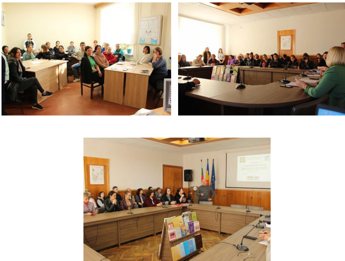
Fig. 3 Ziua Europeană a luptei împotriva traficului de ființe umane.

În perioada de 18 octombrie -25 octombrie 2023 în cadrul Universității s-a desfășurat Campania națională Săptămâna de lupta împotriva traficului de ființe umane . Au fost planificate și realizate următoarele acțiuni de prevenire și combatere a traficului de ființe umane: Masă rotundă cu participarea reprezentanților ai organelor de drept " Lupta împotriva traficului de ființe umane în Republica Moldova"; discuții: „ Traficul uman- realitatea sau mitul”, elaborarea panourilor informative-colaje cu tematica prevenirii traficului de ființe umane, a videoclipurilor și a publicității sociale pentru prevenirea traficului de ființe.