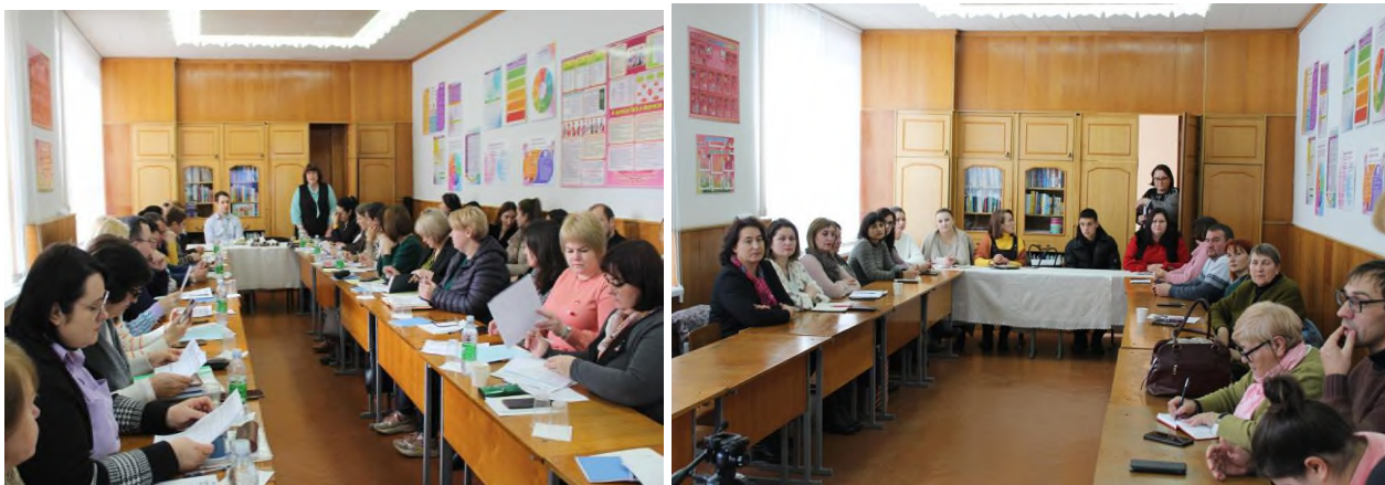
Fig. 8 Masa rotunda cu cadrele manageriale și didactice din instituțiile preuniversitare

Participanții la masa rotundă au fost unanimi că promovarea și dezvoltarea educației interculturale într-un spațiu educațional multiethnic, precum Republica Moldova și în special raionul Taracalia, este relevantă și necesită o atenție deosebită în instituțiile de învățământ de la diferite niveluri.