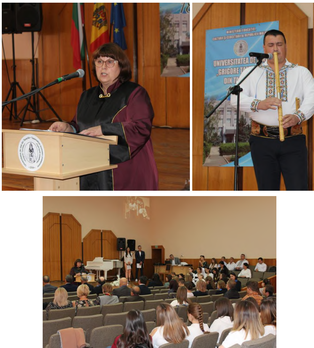
Fig.15 1 octombrie 2023 Universitatea de Stat "Gr.Țamlac" din Taraclia a împlinit 19 ani

1 octombrie 2023 Universitatea de Stat din Taraclia a împlinit 19 ani. La sărbătoare au fost trimise mesaje de felicitare din universitățile din Ucraina, România, Bulgaria.