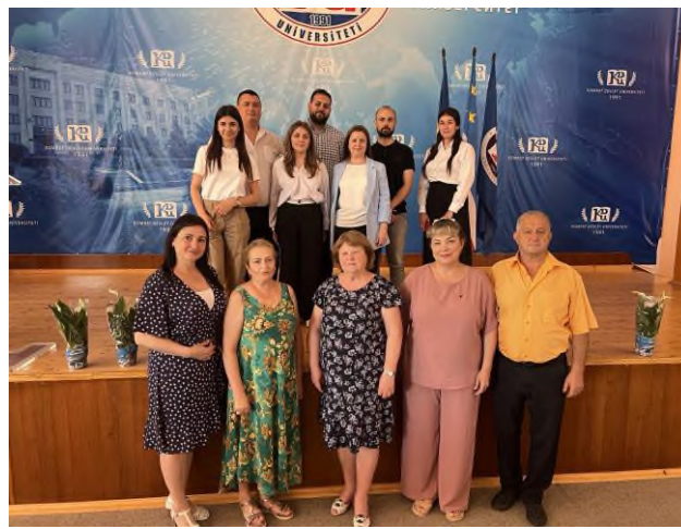
Fig. 1 Examenul de licență la programele de studii "Muzică"