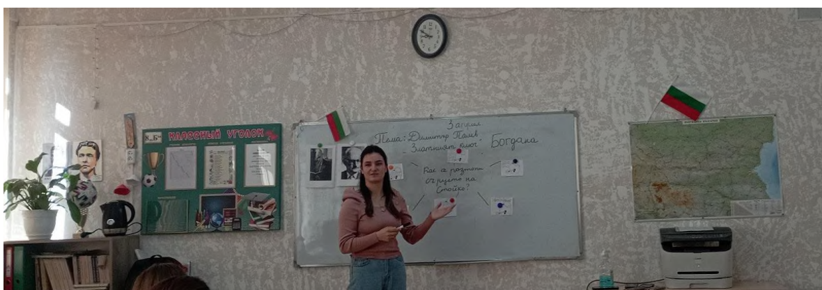
Fig. 4 Stagiul de practică