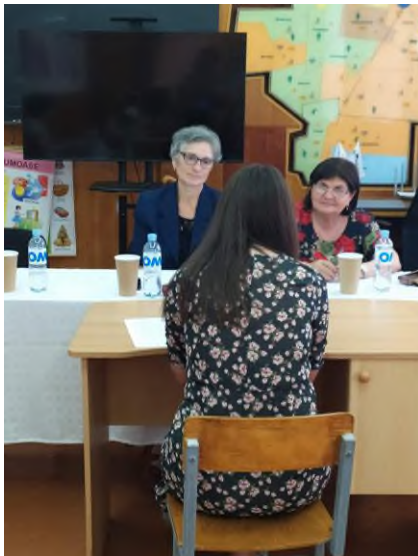
Fig. 2 Examenul de licență la programele de studii "Istorie", "Limba și literatura bulgară/ Limba și literatura română"; Limba și literatura bulgară/ Limba și literatura engleză "Pedagogie preșcolară/ Limba și literatura română"