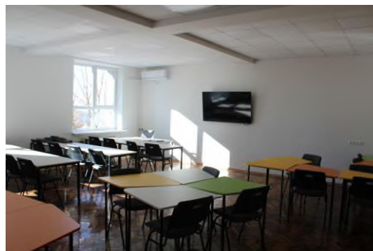
Fig. 6 Centrul TEKWILL Taracalia