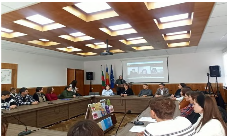
Fig. 7 Briefing, la deschiderea proiectului „Tech for Tomorrow: Enhancing the Digital Transformation Capacities of Youth in Southern Moldova”.

La 29 noiembrie 2023, la Universitatea de Stat din Taraclia a avut loc un briefing, la deschiderea proiectului „Tech for Tomorrow: Enhancing the Digital Transformation Capacities of Youth in Southern Moldova”. Scopul acestui eveniment este de a informa studenții, tinerii antreprenori și alte părți interesate despre noile oportunități oferite în cadrul acestui proiect. Evenimentul are ca scop îmbunătățirea procesului de înțelegere și interacțiune cu tehnologiile digitale, precum și dezvoltarea peisajului digital din raionul Taraclia și întreaga regiune de Sud a Republicii Moldova. La briefingul au participat parteneri strategici în implementarea tehnologiilor digitale, studenți și profesori ai Universității din Taraclia, tineri antreprenori, mass-media și alte părți interesate.