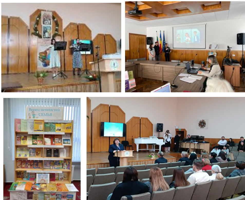
Fig. 9 Ziua familiei

Procesele de transformare demografică au un puternic impact social, economic, politic și cultural, devenind o parte esențială în analiza și dezvoltarea politicilor sociale și economice. Îngrijorarea pentru starea demografică în schimbare, în încercarea de prevenire a unei crize demografice, presupune evaluarea fenomenelor de natalitate, mortalitate și migrație în relație cu dezvoltarea țării (creșterea economică), prin intermediul tehnicilor analitice inovatoare și celor mai bune practici de coordonare a politicilor macroeconomice și sociale. Instituțiile de învățământ superior din Republica Moldova resimt criza demografică prin micșorarea constantă a numărului absolvenților de liceu și respectiv a persoanelor care doresc să-și continue studiile în Republica Moldova. În planurile de învățământ este inclusă unitatea de curs "Educație parentală" (30 de ore/2 credite). Studenții US Taraclia au participat la activitățile culturale, consacrate Zilei Internaționale a familiei la 15 mai 2024.