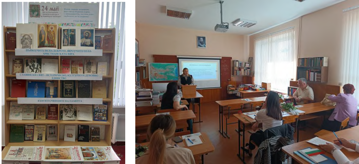
Fig. 13 Conferință științifică - practică anuală dedicată Zilei scrisului și culturii slavone